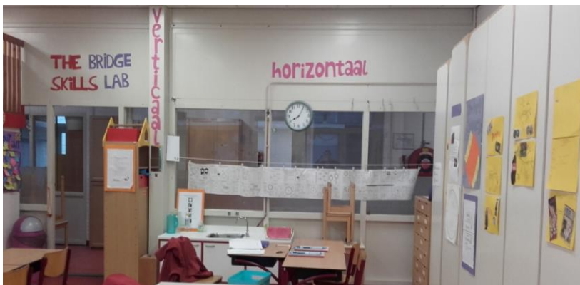
Het nieuwe tutorlokaal op de Wadden Molenwijk